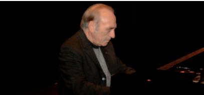
Miguel-Angel Estrella, Ambassadeur permanent d'Argentine auprès de l'UNESCO, fondateur de L'ORCHESTRE POUR LA PAIX,