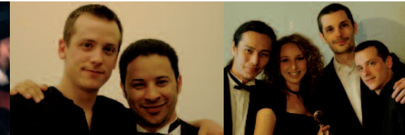
15 nationalités depuis la création (Algérie, Allemagne, Egypte, France, Iran, Irak, Israël, Jordanie, Liban, Maroc, Ouzbékistan, Palestine, Syrie, Tunisie, Turquie)